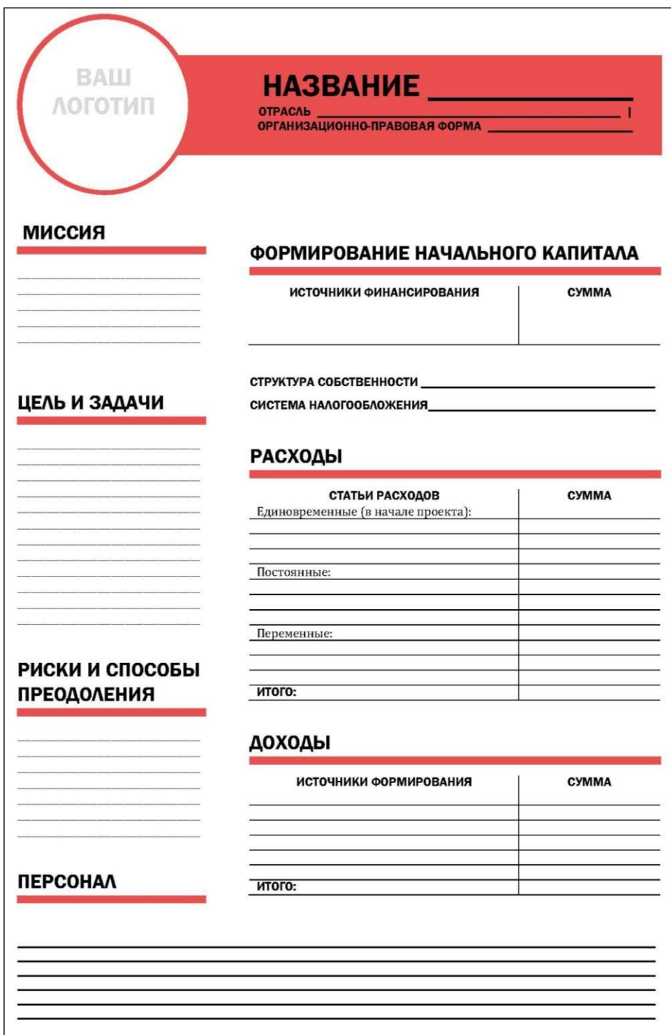
Рисунок 2 – Макет «Условия бизнеса»