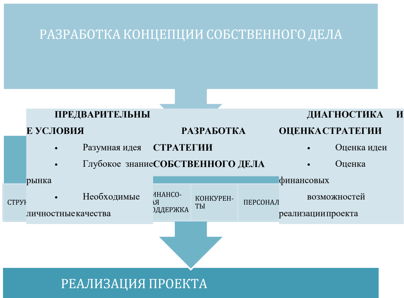
Рисунок 1 – Процесс создания бизнеса

Взвесив все «за» и «против», вы решили для себя, что готовы начать собственное дело? Тогда рассмотрим процесс организации бизнеса (рис. 1).